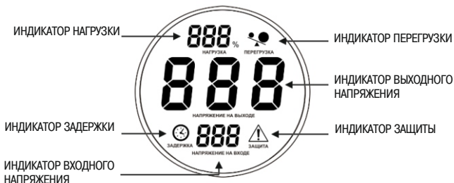
Рисунок 3 – Индикация режимов работы стабилизаторов

– в стабилизаторах мощностью 3 до 12 кВА однополюсным автоматическим выключателем (двухполюсным для исполнения 12 кВА), параметры которого приведены в таблице 4.