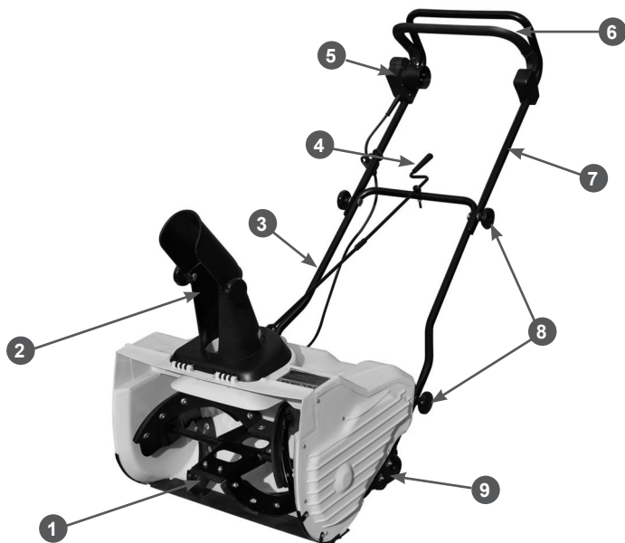
Рис.1 Основные узлы и органы управления