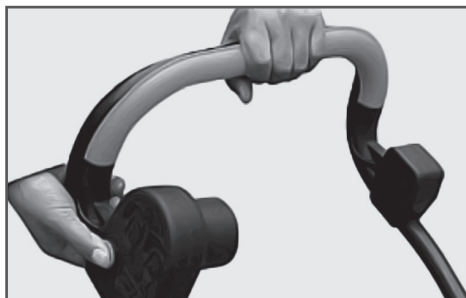
Рис.3 Запуск электродвигателя