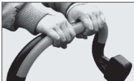
Рис.4 Рычаг безопасности